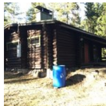
Väransbyn maja Kirkonummella