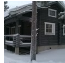
Saariselän isompi maja Hoppu